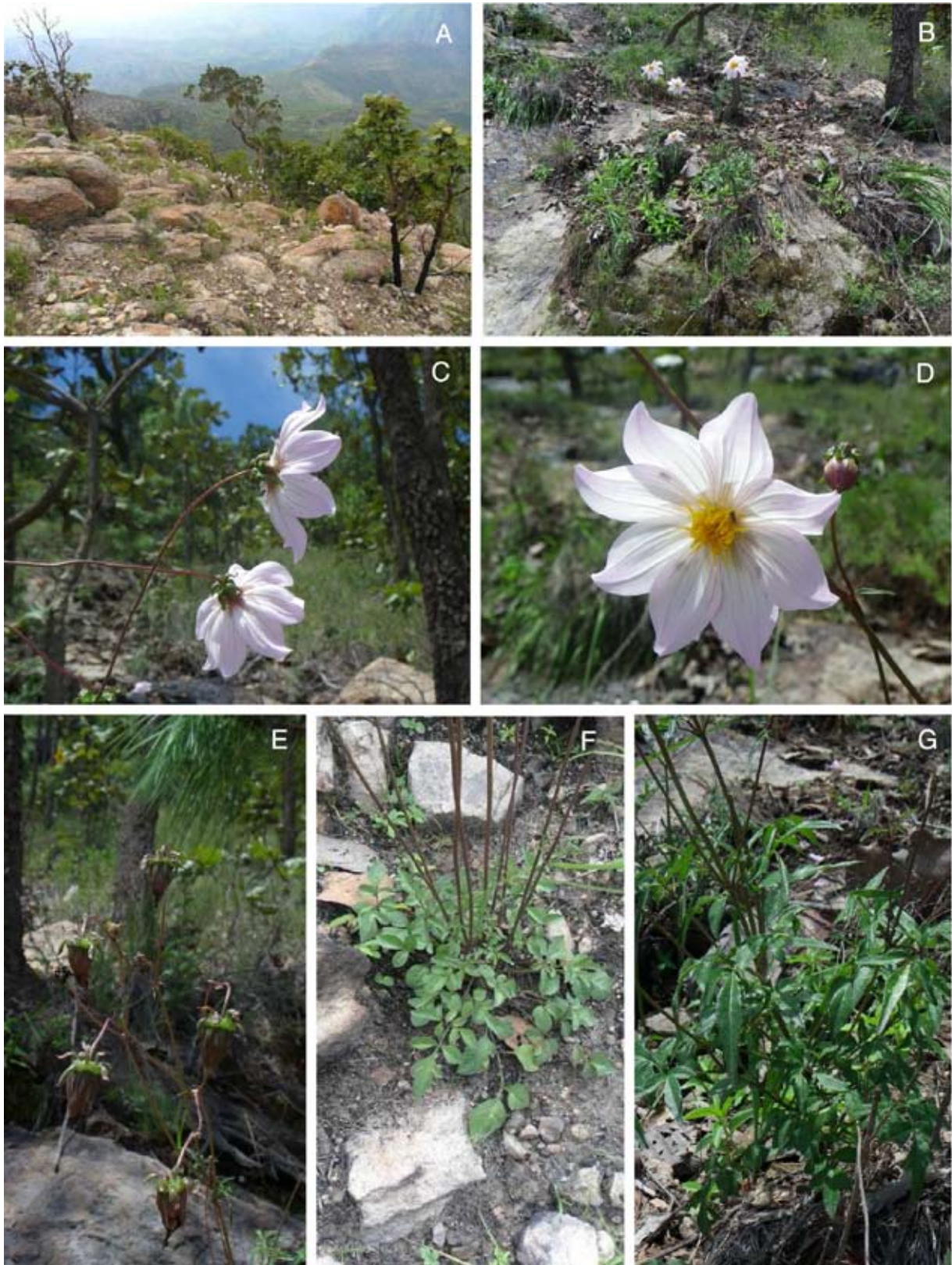
Figura 3. Dahlia wixarika Art. Castro, M. Carrasco-Ortiz & Aaron Rodr. A) hábitat, B) hábito, C) vista lateral de los capítulos y filarias, D) vista frontal del capítulo, E) capítulos en fructificación, F, G) variabilidad foliar.