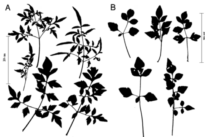
Figura 4. Morfología foliar comparada entre Dahlia wixarika (A) y D. pugana (B).

ácidos del bosque mixto de Quercus y Pinus . La zona constituye la transición entre la Faja Volcánica Transmexicana y la Sierra Madre Occidental. Las exploraciones botánicas y revisiones de herbario recientes, hechas por los autores, han permitido localizar nuevas poblaciones y especímenes.